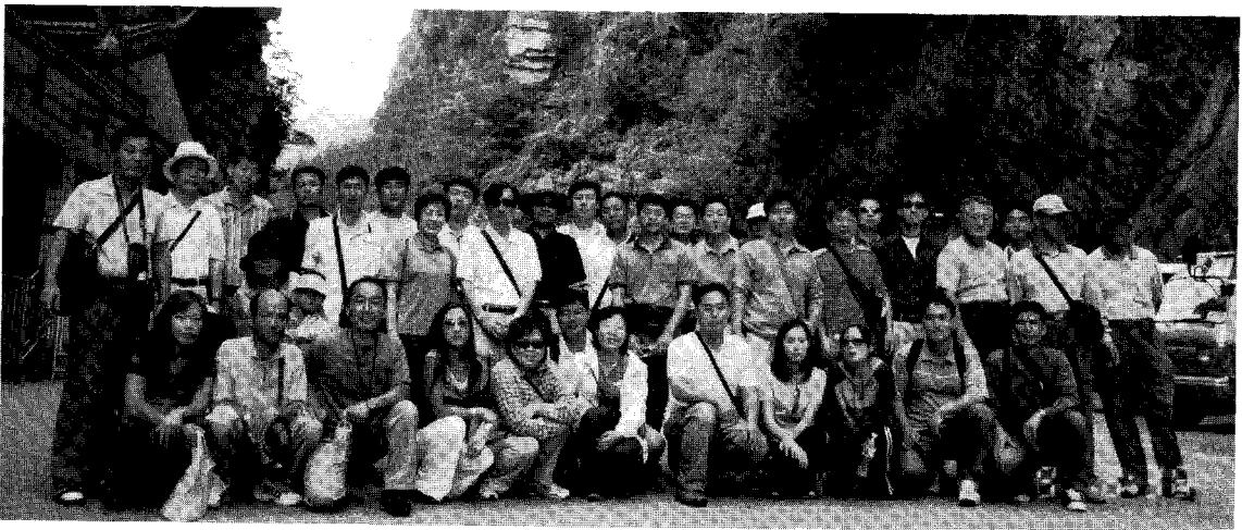
중국을 방문한 참관단 일행 - 장가계 천자산에서(좌 첫번째 필자)

특히 개방이후 육계산업은 계열화 사업이 발전되고 있으나 주요질병들이 계속적으로 발생