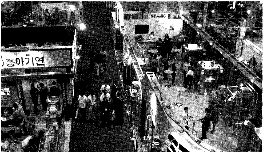
▲ 코리아팩 2003 전경

코리아팩 2004에서는 전시기간 중 기술세미나를 개최하고 우수포장 디자인 특별관 / Good Packaging Pavilion을 여는 등 다양한 부대행사