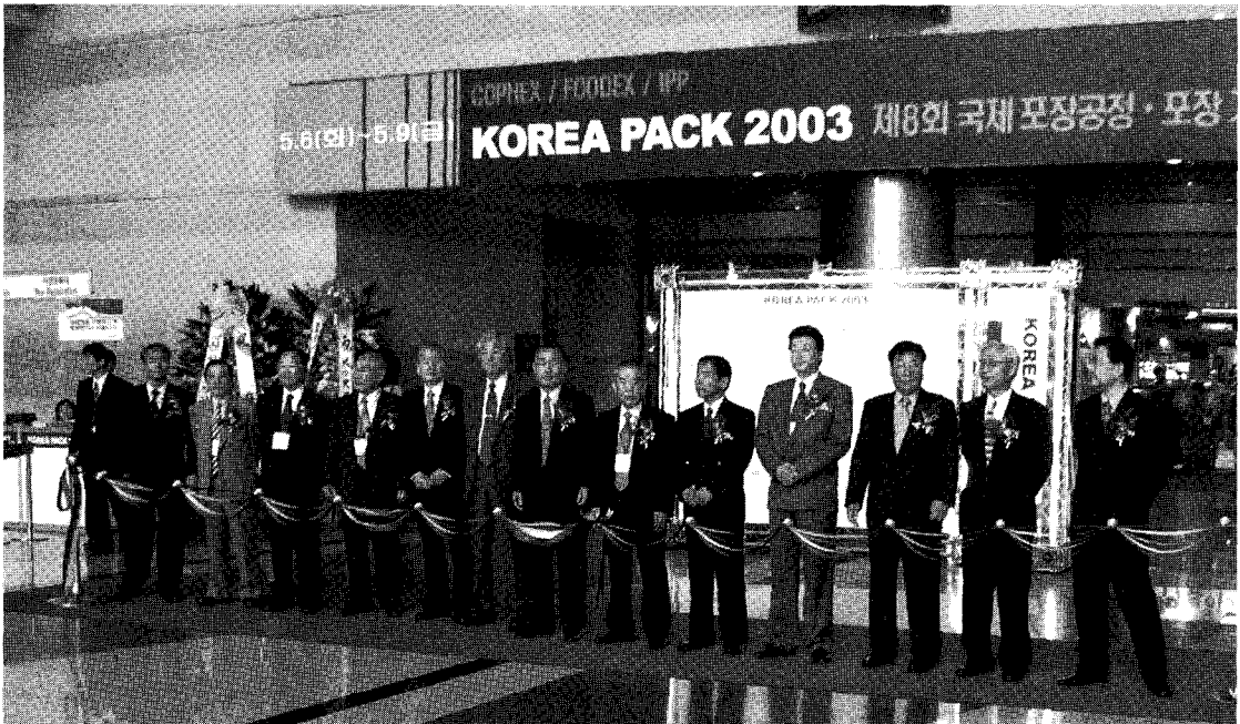
▲ 지난해 개최된 코리아팩 2003 개막식

각종 포장재료, 포장기계, 포장가공기계, 시험 검사장비, 물류장비, 식품 제약 화장품관련 설비 등이 총망라되어 전시되는 이번 전시회는 25개국 350개사가 참가했던 지난해와 비교해 참가업체 및 전시 부스가 더욱 늘어난 30개국 370개사 800부스 규모로 개최될 예정이다.