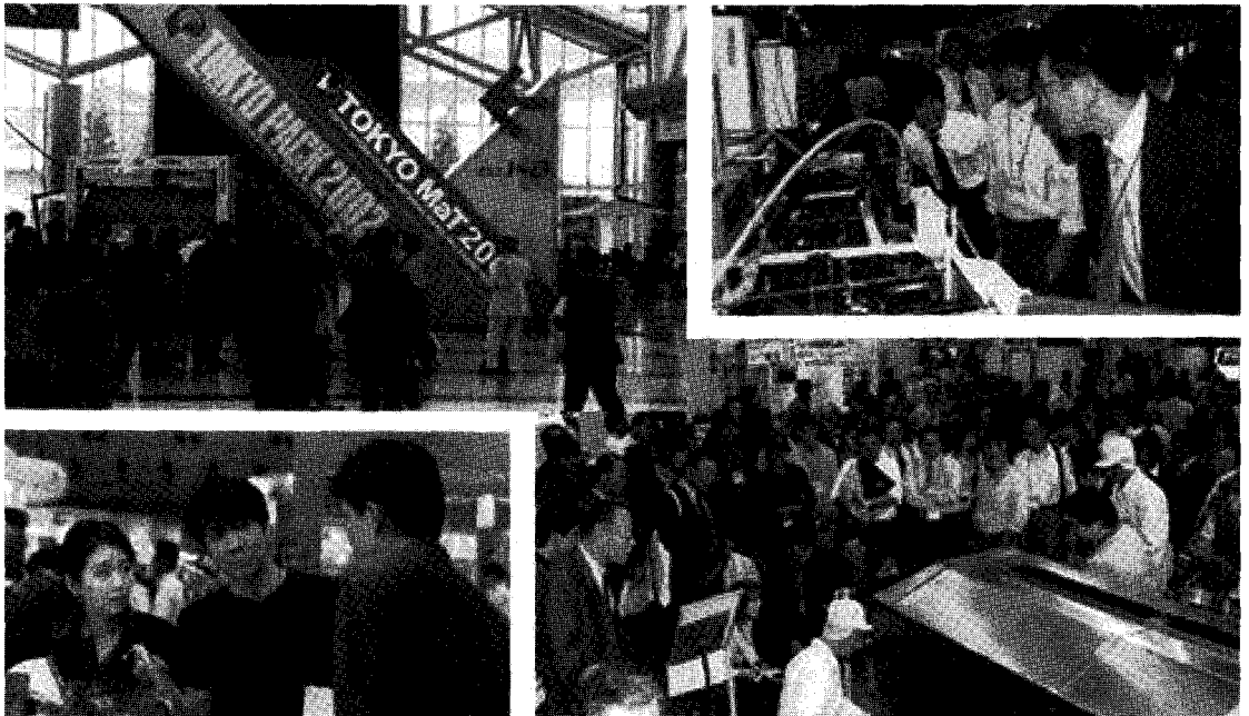
▲ 아시아 최대규모 포장전시회 일본 도쿄팩

매 짝수년도마다 파리에서 개최되는 엠발라쥬(EMBALLAGE)는 식품, 화장품, 의약품 포장