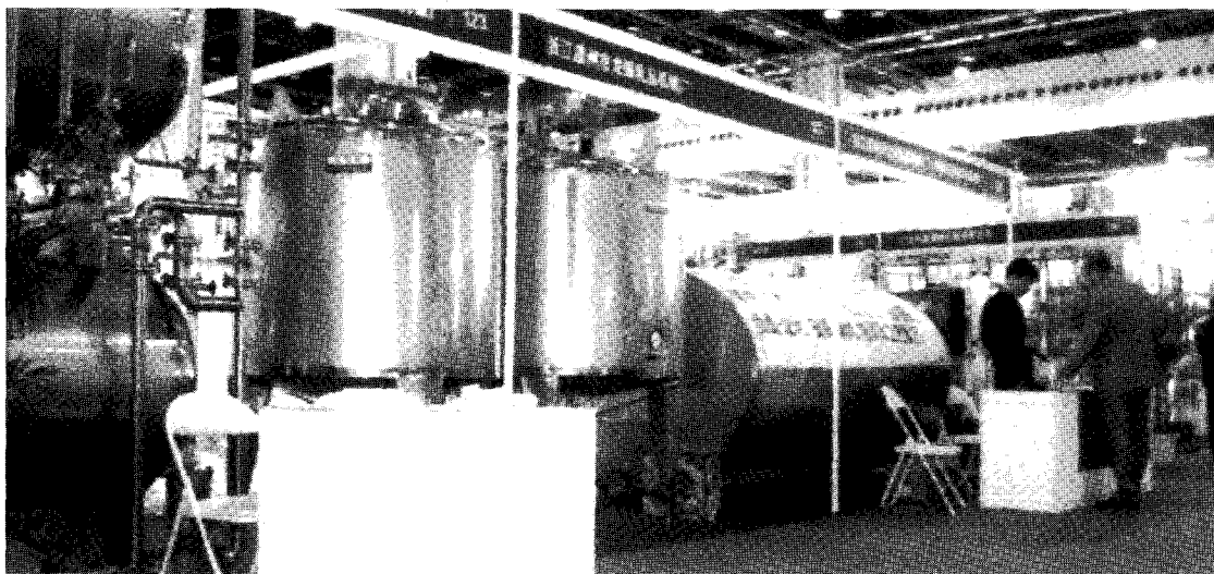
▲ 예견된 거대 포장 시장 중국 상하이 국제 포장 박람회

유럽을 위시한 미국, 일본 등 포장기자재 선진국의 참가로 중국의 포장기자재 회사가 대거 참여하는 중국 최대의 포장 기자재 국제 박람회인