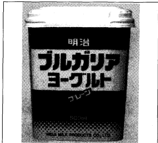
[사진 2] 1981년 새로운 용기도입