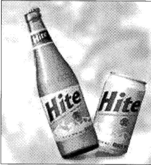
▲ 기존에 시판된 병맥주와 캔맥주

이다. 맥주용 PET병이 시판되면서 캔과 유리병 맥주의 판매량은 감소 추세로 이어지고 있다. 조만간 1.0l, 0.7l, 0.5l 등 소용량 PET병 맥주가 연달아 출시되면 캔과 유리병의 비율이 더욱 축소될 전망이다. 외국의 경우 PET병 맥주를 일찍이 출시한 노르웨이, 체코, 러시아 등 유럽국가에서는 현재 국가별로 15~30%의 시장 점유율을 차지하고 있다.