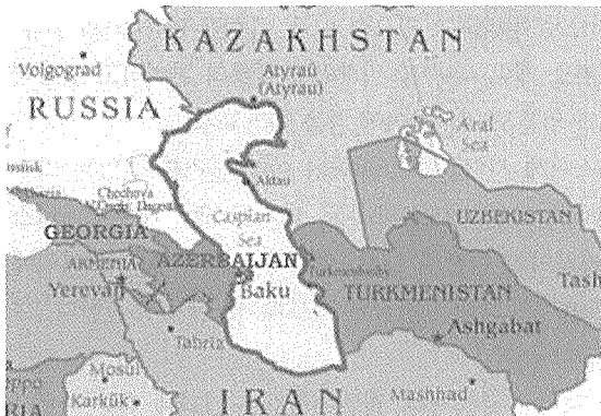
[그림 1] 카스피해 및 연안 지역