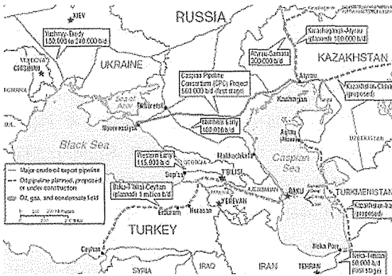
[그림 2] 카스피해 지역 원유, 가스 배관망도

흑해연안 수스파(Suspa)항에 이르는 총 연장 900km, 연 510만 톤의 송유관이 있으며 이 항구에서 흑해를 통하여 선박으로 보스포러스 해협을 통과, 서방으로 수출한다. 그러나 이 항구의 원유 적하능력은 불충분하다.