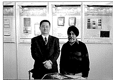
「뉴델리 Pragati Maidan에서 개최된 인도 최대 전력전문 전시회인 ELECRAMA 2004 참가 모습」

이를 위하여 지역 요구에 따른 제품별 수출형 모델 개발 및 변형, 현지어 카탈로그 및 기술 자료 제작, 그리고 현지 판매 가능하도록 형식승인시험 등을 추진중에 있다.