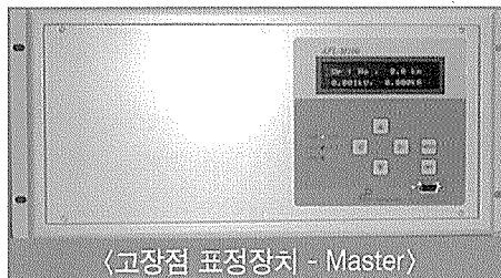
<고장점 표정장치 - Master>

특히, 철도기술연구원, 명지대 차세대전력기술연구센터 등과 함께 개발한 “전기철도 급전선 고장점 표정장치 (Fault Locator)”의 상품화에 성공, 일본제품의 수입 대체 효과를 이룩하였고 현장 관계자들로부터 일본제품을 능가하는 기능 및 그 기술에 대해 호평을 받았으며 이를 계기로, 오는 4월 개통을 목표로 현재 시험운전 중인 “호남선 전