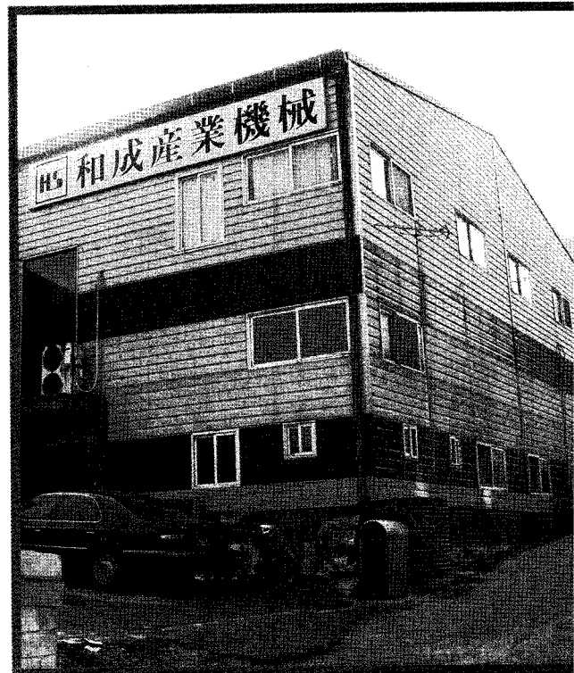
◀입주 예정인 제2공장전경(좌측) ▲ 제1공장 전경

요성은 골판지포장인들이라면 모두 실감하고 있지만, 골판지포장산업의 현안문제를 이슈화하여 그에 대한 해결책을 찾을 수 있는 장이 되도록 노력하여 주시기 바랍니다. 아울러 골판지포장업 관련 종사자 여러분 새해 복 많이 받으시길 바랍니다.