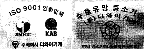
(주)디와이기계는 2001년 ISO9001인증을 받았으며 2003년 수출유망 중소기업에 선정되었다.

골판지포장산업계를 대변하는 잡지로서 국내 골판지 업계 경영자들에게 국산포장기계에 대하여 인식을 바꾸어서 믿고 사용할 수 있도록 홍보 및 정보가 제공 되었으면 합니다.