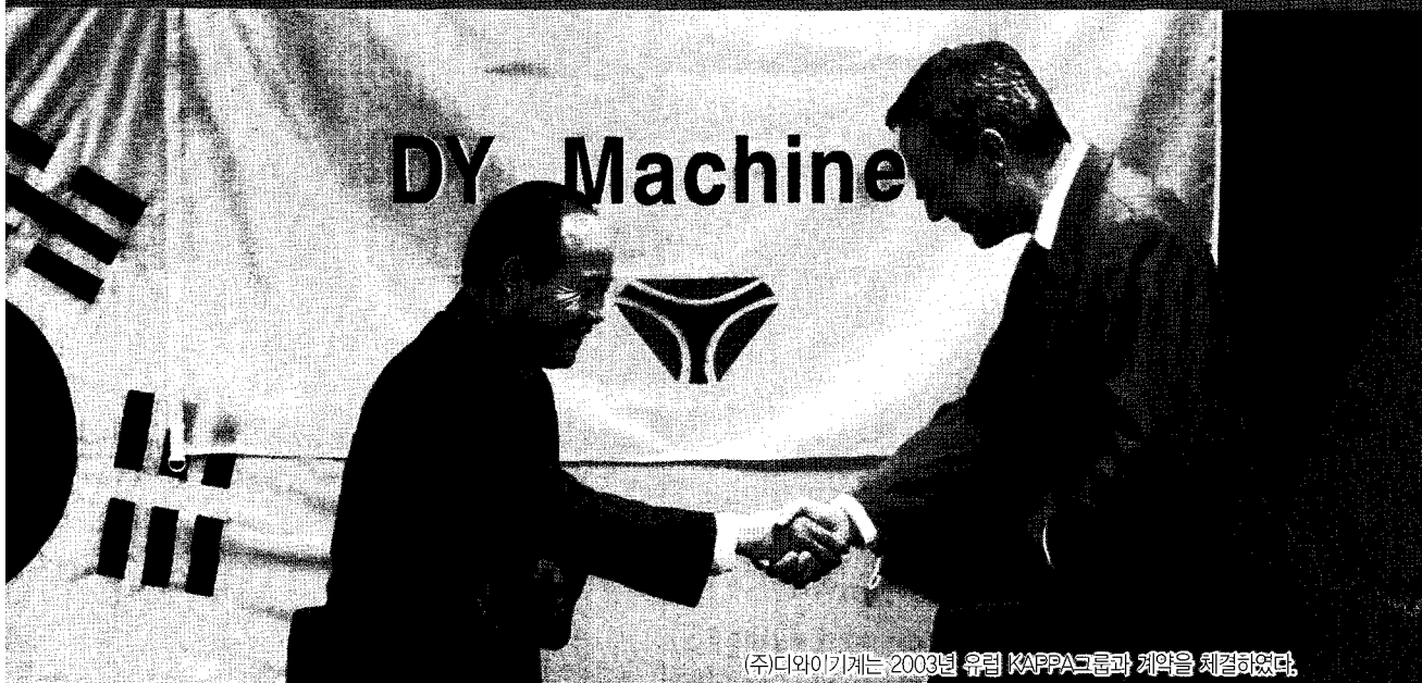
(주)디와이기계는 2003년 유럽 KAPPA그룹과 계약을 체결하였다.

2004년도 매출목표는 90억 정도로 하고 수출을 60% 이상을 할 계획으로 전사원이 노력하고 있습니다.