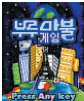
▲ 모바일 부루마블 게임 화면