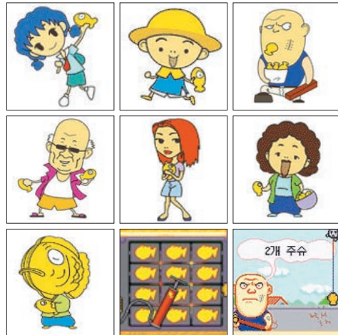
▲ 붕어빵타이쿤2 캐릭터

한편, 이번 엠플러그의 조사에서 컴투스는 3개의 게임을 순위에 올려 지난해 최고의 모바일게임 개발업체였음을 반증했다.