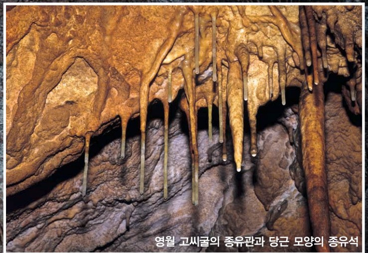
영월 고씨굴의 종유관과 당근 모양의 종유석