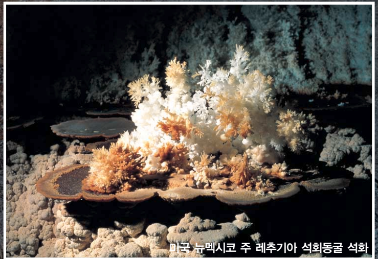
미국 뉴멕시코 주 레추기아 석회동굴 석화