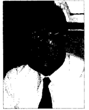
글 | 박수영 전 사무처장(대한수의사회)

그 레이트 데인(Great Dane)은 대형견들 중에 서도 가장 키가 큰 견종이지만 단지 크다는 표현은 이 견종을 나타내기에 충분하지 않다. 오히려 이들은 우아하다는 표현이 어울리며 큰 체구에 비해 온화한 성품을 지니고 있다.