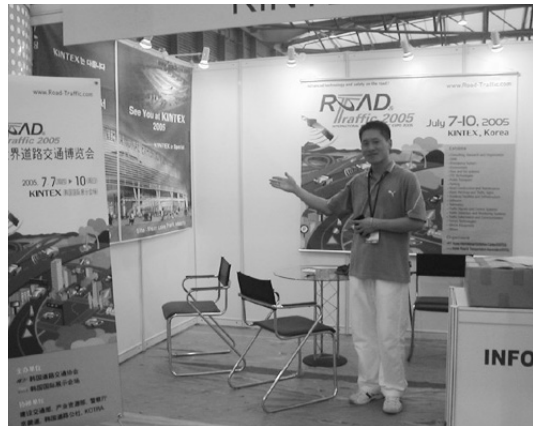
2005 도로교통박람회 홍보 부스