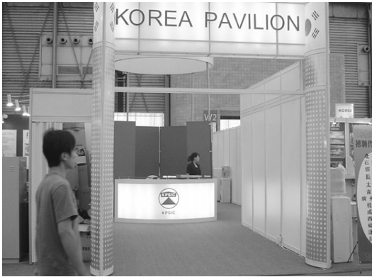
한국관 전시장 입구