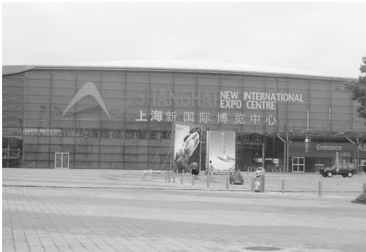
중국 상해시 상해신국제엑스포 센터