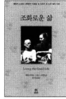
조화로운 삶 보리