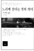
느리게 산다는 것의 의미 동문선