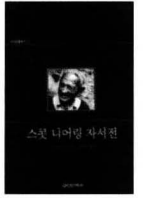
스콧 니어링의 자서전 실천문학사

면 우리 사회에서 느림의 추구, 자연 회귀의 욕구, 단순성에의 동경 등과 연관된 문화생산은 외국인들의 몫이었다. 서양의 논리가 가진 문제점에 대한 대안적 모색으로 동양적 사유를 끌어왔지만, 이의 텍스트는 다시 서양의 논리로 차용하는 모순이 벌어지고 있다는 것. 나아가 단순함, 느림, 휴식 등이 제멋대로 해도 해고될 염려가 없는 부류의 사람들에게나 가능한 일이라고 지적한다. 그런 덕목을 주장하려면 사회 구성원 대부분이 느림을 향유할 기회를 가질 수 있는 문화·사회·경제·정치 전반에 걸친 조건이 형성되어야 한다는 것이다.