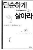
단순하게 살아라 김영사