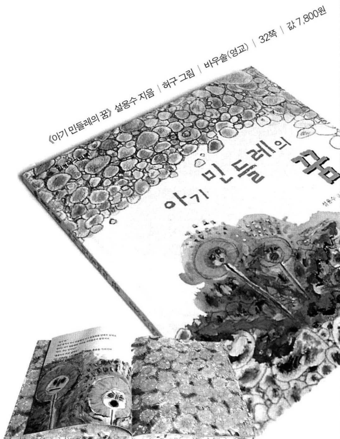
《아이 민들레의 꿈》 설용수 지음 | 허구 그림 | 바우솔(영교) | 32쪽 | 값 7,800원