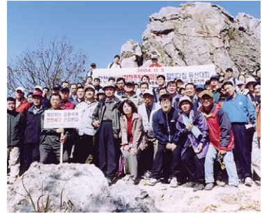
▲ 포항지회 산재추방 캠페인

안전협회 각 지회에서는 산재 예방을 위한 여러 활동들이 끊임없이 이어지고 있다.