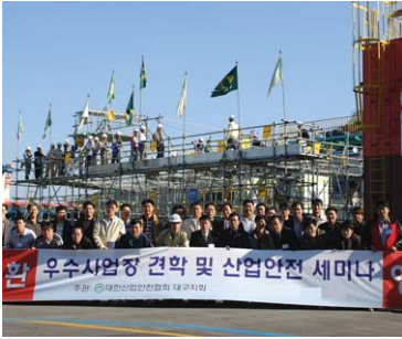
▲ 대구지회 거제조선소 견학