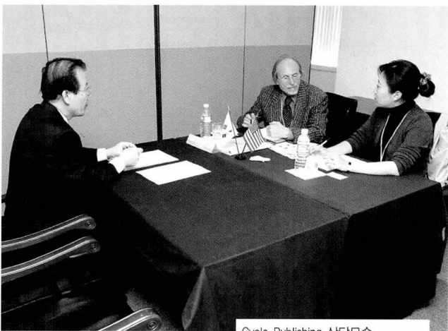
Cycle Publishing 상담모습