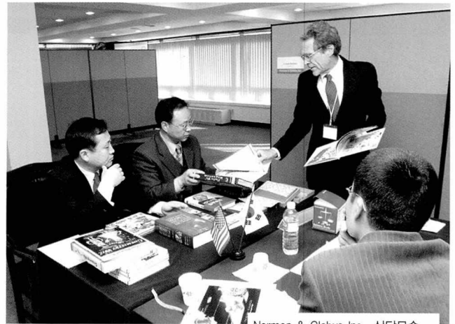
Norman & Globus Inc., 상담모습