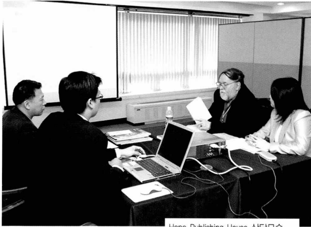
Hope Publishing House 상담모습