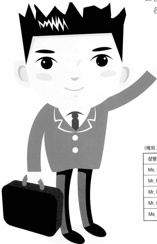
<해외 초청 바이어 및 에이전트>

1985년에 설립된 Parallax Press는 베트남 선(禪) 지도자 틱낫한을 비롯해 불교와 관련된 책과 테이프를 출판하는 ‘통일불교인사찰사’의 출판부서이다. 틱낫한의 주제를 충실히 따르