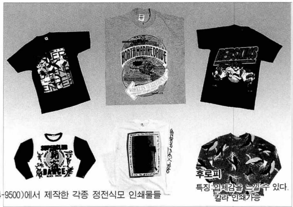
한국특수종합인쇄(031-564-9500)에서 제작한 각종 정전식모 인쇄물들