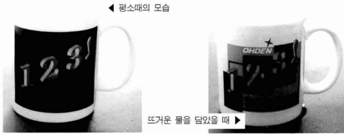
〈다이인쇄에서 제작한 시온인쇄 제품들〉