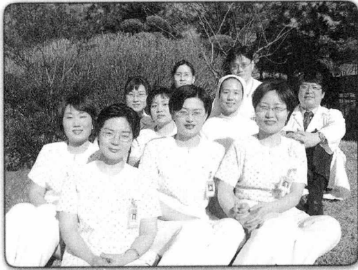
◀ 호스피스 병동가족