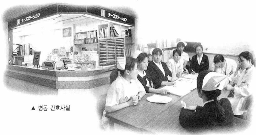
▲ 병동 간호사실