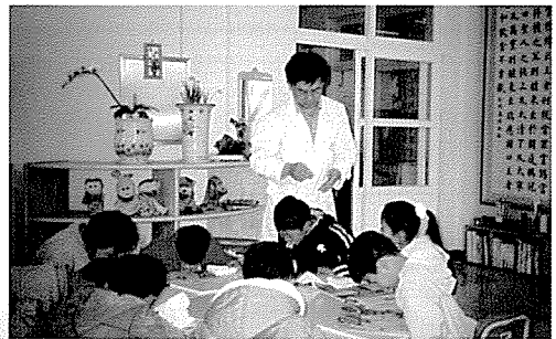
▲ 제주지부는 교도시설인 제주소년원, 물메초등학교 외 137개교 등의 원생 및 중식지원학생, 기초생활보장수급권자, 일반주민 6204명에게 무료건강검진을 실시했다.