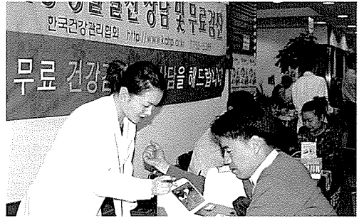
▲ 대구지부는 장애인복지시설인 청구재활원 등의 원생 및 일반주민 550여명에게 무료건강검진을 실시했다.