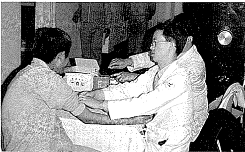
▲ 전북지부는 장애인복지시설인 전주사랑의 집, 교도시설인 전주소년원 등의 원생 및 기초생활보장수급권자, 일반주민 2604명에게 무료건강검진을 실시했다.