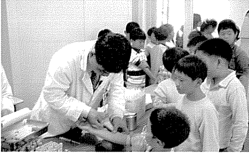
▲ 서울지부는 일반주민 등 800여 명에게 무료건강검진을 실시하였다.

한국건강관리협회는 어려운 이웃을 위한 봉사활동을 전개하고 있습니다. 지난 10월 한달 동안에도 1만 3천 5백여 명에게 무료 건강검진과 건강상담을 실시하였습니다.