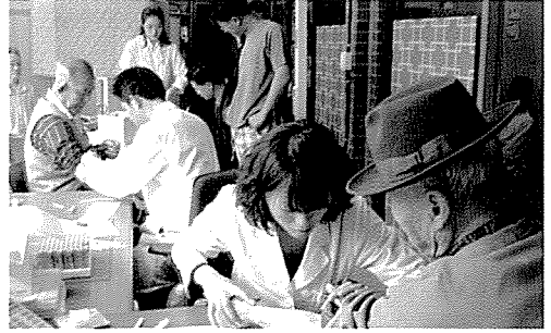
▲ 전북지부는 장애인시설 생활자, 벼·오지주민, 중식지원학생 등 500여 명에게 무료건강검진을 실시하였다.