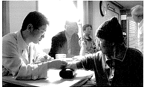
▲ 제주지부는 노인복지시설 생활자, 일반주민 등 400여 명에게 무료건강검진을 실시하였다.