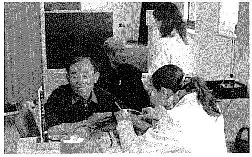
▲ 대전·충남지부는 노인복지시설인 대전노인요양원 외 1개소, 아동복지시설인 성우보육원, 교도시설인 대덕소년원 외 2개소, 장애인복지시설인 동곡요양원 등의 원생 및 일반주민 580여명에게 무료건강검진을 실시했다.