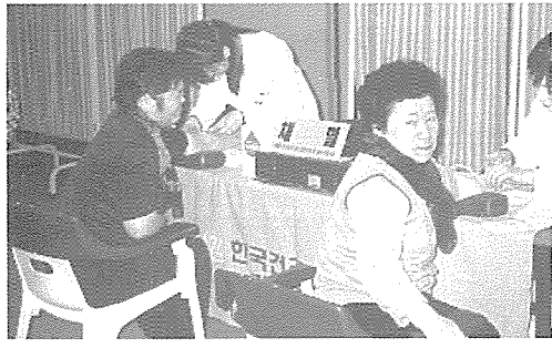
▲ 경남지부는 아동복지시설인 영신요양원 등의 원생 및 기초생활보장수급권자, 일반주민 150여명에게 무료건강검진을 실시했다.