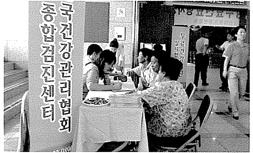
▲ 대전·충남지부는 금산인삼축제 참가자, 장애인시설인 대전정신요양원생 등 920여 명에게 무료건강검진을 실시하였다.