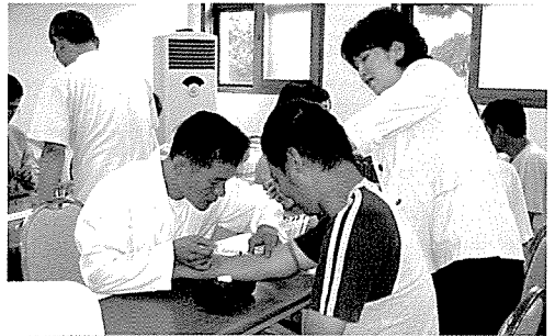
▲ 제주지부는 노숙자, 제주시립희망원생, 제주양로원생, 일반주민 등 460여 명에게 무료건강검진을 실시하였다.