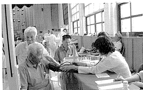
▲ 전북지부는 장애인복지시설인 영산의집, 전주덕진중학교 등의 원생 및 중식지원학생, 일반주민, 기초생활보장수급권자 600여 명에게 무료건강검진을 실시하였다.