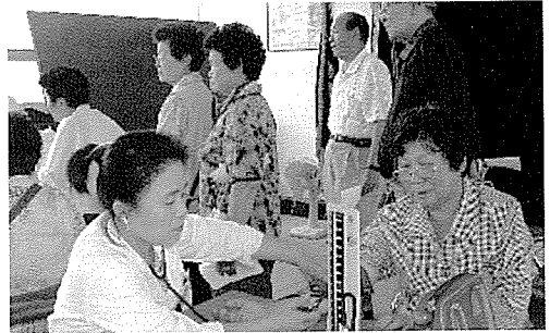
▲ 강원지부는 한서초등학교 외 6개교 등의 중식지원학생 190여 명에게 무료건강검진을 실시하였다.