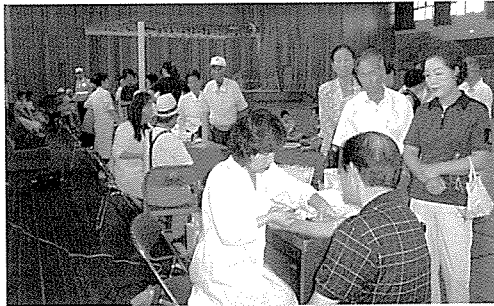
▲ 충북지부는 교정시설인 청주여자교도소, 상당초등학교 외 41개교 등의 원생 및 중식지원학생, 일반주민 730여 명에게 무료건강검진을 실시하였다.