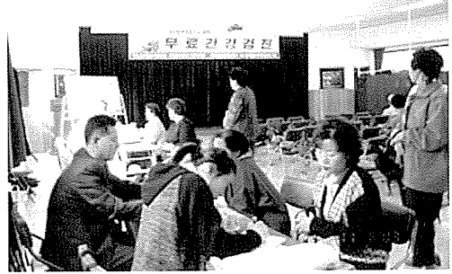
▲ 대구지부는 아동복지시설인 애생보육원, 교동초등학교 외 31개교 등의 원생 및 중식지원학생, 일반주민 2,190여명에게 무료건강검진을 실시했다.