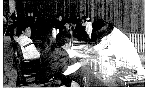
▲ 강원지부는 노인복지시설인 동해노인복지관 등의 원생 및 장애인 60여명에게 무료건강검진을 실시했다.