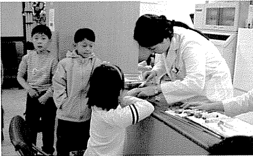
▲ 서울지부는 노인복지시설인 석암재활원 외 1개소, 아동복지시설인 지은보육원, 가양초등학교, 경서중학교 외 3개교 등의 원생 및 중식지원학생 810여명에게 무료건강검진을 실시했다.

한국건강관리협회는 봉사과 희생을 실천하고 있습니다. 지난 11월 한달 동안에도 1만 2천 3백 여명에게 무료건강검진과 건강상담을 실시하여 아름다운 만남을 실천하였습니다.