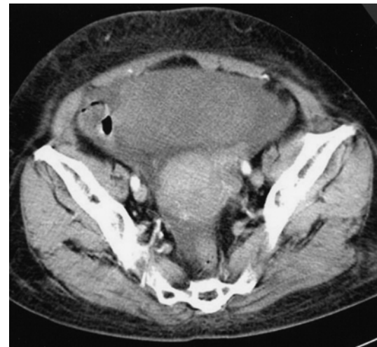
Fig. 2. Chest CT shows a left ovarian mass (13×10cm), with pelvic infiltration and ascites.

화 단층 촬영상 골반강의 좌측난소에 13×10 cm의 종괴가 관찰되었으며 주위에 소량의 복수가 동반되어 있었다(Fig. 2).