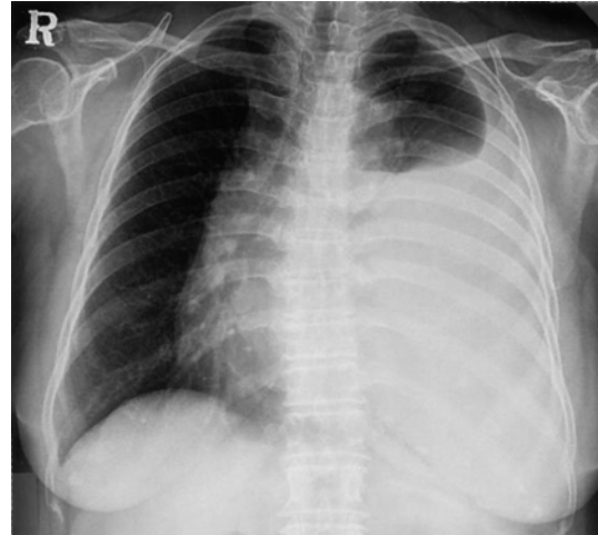
Fig. 1. Chest radiograph shows large amount pleural effusion on the left lung.

방사선학적 소견 : 단순 흉부 촬영에서 좌측 폐야에 다량의 흉수가 발견되었고(Fig. 1), 과거력상 산부인과적 문제를 평가하기 위해 실시한 복부 전산