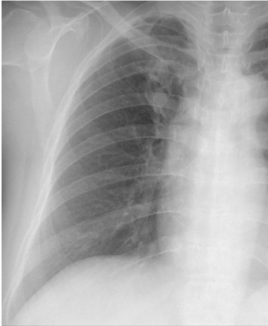
Fig. 1. Magnified chest radiograph of the right lung shows a pulmonary nodule in the right upper lobe. A surrounding radiolucent area is not evident.

우연히 발견된 폐종괴가 폐암 가능성이 있다는 이야기를 듣고 내원하였다. 3개월 전에 당뇨병 진단을 받은 과거력이 있었다. 이학적 소견이나 검사 소견에서 특이 소견은 없었다. 흉부방사선에서 우상폐야에 경계가 불분명한 폐결절이 관찰되었으며 주위에 다른 소견은 관찰되지 않았다(Fig. 1). 이 폐결절은 흉부 전산화단층촬영에서 분지 모양을 하고, 석회화가 없으며, 조영 증강이 안되는, 저음영의 연조직이었다(Fig. 2). 흡기 상태에서 촬영한 고해상전산화단층촬영에서 우상엽의 폐첨분절(apical segment)에 분지되는 형태의 연조직 음영이 관찰되고 주위의 폐실질에는 저음영이 관찰되었다(Figs. 2b and 2c). 호기 상태에 촬영한 고해상전산화단층촬영에서는 저음영 부위가 흡기 때에 비해 주위보다 훨씬 더 낮게 보여 저음영 부위가 공기포획(air trapping) 때문임을 시사하였다(Fig.