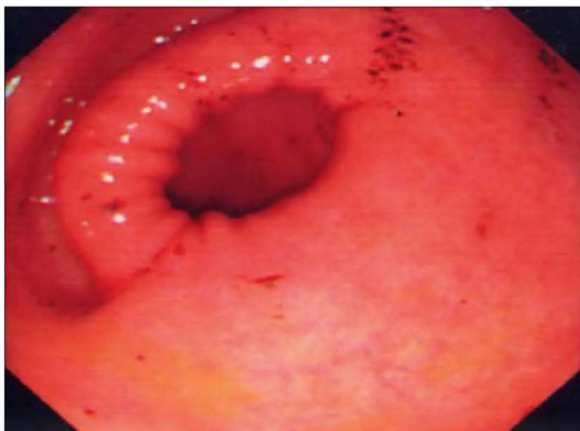
Fig. 1. Purpuritic mucosal lesions and petechiae were noted on the antrum with gastroduodenal endoscopy.