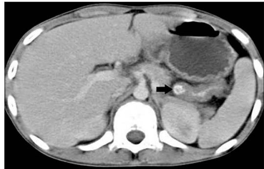
Fig. 2. Abdominal CT scan shows intramural hematoma in proximal jejunum (→) and diffuse bowel wall thickening in small bowel loops with enlarged lymph nodes in mesenteric root.

현병력: 내원 4일 전 미만성 복통과 피부자반 증상 있어 본원 응급실 내원하였고 이후 복통이 악화가 되고 구토가 동반되어 이에 대한 검사 및 치료를 위