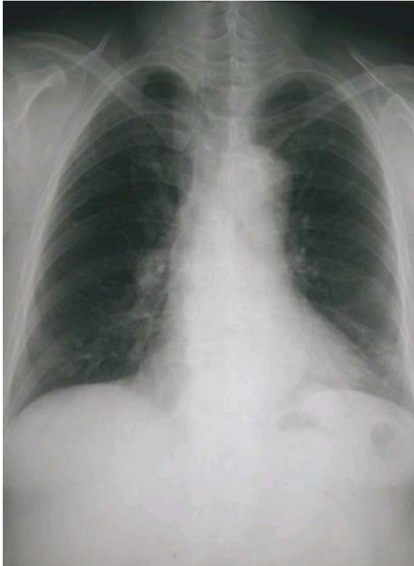
Figure 1. Chest PA on admission shows minimal consolidation on the left lower lung field.

않았으며, 흉부 진찰에서 청진상 거친 호흡음과 좌측 폐야에 잡음 및 천명이 청진되었다. 심 잡음은 들리지 않았으며, 복부 압통이나 사지의 이상소견은 관찰되지 않았다.