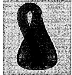
<그림 2> 클라인병2