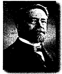
<그림 1> 클라인

일반인들에게 클라인 병으로 더 유명한 Felix Klein은 1849년 독일 뒤셀도르프에서 태어나서 1865년에서 1866년까지 본(Bonn)대학에서 수학과 물리학을 공부하였다. Klein은 Plücker 교수의 지도로 1868년 본(Bonn)대학에서 박사학위를 받았다. 그는 괴팅겐, 베를린 대학 등을 방문하여 연구하였으며, 1870년 파리로 유학하여 노르웨이 수학자 M. S. 리(Marius Sophus Lie)를 비롯한 많은 프랑스 수학자들에게 배웠다. 특히 M. S. 리와의 만남은 그의 생애에 큰 영향을 끼쳤다. 그는 M. S.리로부터 군론(group theory)의 중요성을 배우게 되어 그 뒤 두 사람은 군론의 두가지 분야를 집중적으로 연구하여 이 군개념을 그 자신 및 제자들의 많은 연구에 응용하였다. 이 연구는 그가 에를랑겐 대학의 교수로 취임할 때 발표한 <에를랑겐 계획 : Erlangen Programm>에도 큰 영향을 미쳤다. 그의 취임 강연은 <기하학이란 어떤 변환군에 의해 변하지 않는 성질을 연구하는 것으로서 변환군의 분류에 의해 기하학 분류가 가능하다.>는 주제로서, 당시 존재하던 모든 기하학을 포괄하면서 군론의 입장에서 기하학을 분류하고 본질적으로 특성화하는 데 기여하였고, 기하학이 나아가갈 새로운 방향을 제시하였다. 그는 수학에서도 많은 위대한 업적을 남겼는데, 이 글에서는 그의 수학적 업적은 생략하고 그가 수학교육에 기여한 부분을 소개하겠다.