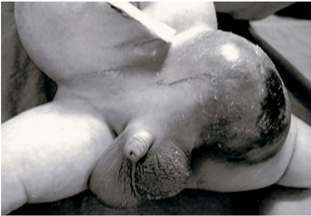
Fig. 1. Gross finding of the tumor at birth, showing a huge mass on the left inguinal area, measuring 10 x 10 cm in maximum dimension. The mass is engorged, and dark-blue colored by internal hemorrhage.

수 분당 124회, 호흡수 분당 120회였으며 체온은 상당히 낮았다. 이학적 검사상 환아는 창백하였고, 청색증을 띠었다. 좌 서혜부 종괴는 약 10×10 cm 정도였고 혈관이 많이 발달되어 있었으며 내부의 출혈로 인해 검푸른 색을 띠었다 (그림 1). 모세혈관 가스 검사상 PH 6.8, PaO 2 43.3 mmHg, PaCO 2 53 mmHg, HCO 3 7 mM/L, SaO 2 58%였고, 혈액 검사 상 WBC 19,400/mm 3 (Seg:64.2%), Hg 10.8 mg/dL, Hct 30.8%, Platelet 84,000/mm 3 , PT 35.7%, PT INR 1.91, Anti-thrombin III 38.1% (정상치: 39-87), D-dimer >2,000 ug/L (정상치: 68-494)로 범발성 응고 장애소견을 보였다. 또한 소변을 보지 못하고 BUN 52.3 mg/dL, Cr 3.13 mg/dL로 급성 신부전의 소견을 보였다.