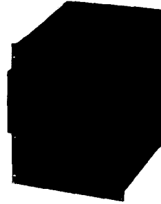
그림 1. SGS 시스템 형상

안기능을 제공하는 하드웨어 기반 고성능 침해탐지 기술과 과다 트래픽 감지기술에 대하여 알아보고, 현재 한국전자통신연구원 네트워크 보안그룹에서 개발하고 있는 보안게이트웨이 시스템(SGS : Security Gateway System)에 대하여도 알아보려고 한다.