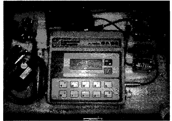
Fig. 3. Infrared Gas Analyzer.