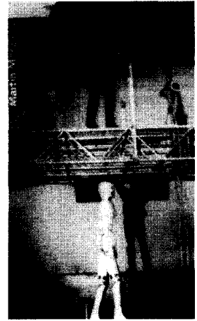
<사진7> '98 F/W M. Margiela, 실물크기 인형 Radical Fashion(2001), p. 45.

미니멀리즘적 요소는 지속적으로 소구되는 연출 기법으로 독자적으로 패션쇼의 주체적 역할을 할 수 있고 패션쇼의 전형을 고수하고자 하는 순수한 차원으로 이해된다. 패션쇼의 연극적 요소와 퍼포먼스적 요소는 2000년대 들어 점차 감소하고 미래지향적인 테크니컬한 감각의 미니멀리즘적 연출이 증가되고