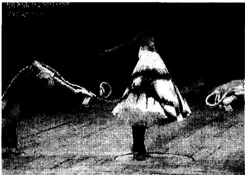
<사진 6> '99 F/W Alexander McQueen. 인공 로봇, Vogue Korea (1994. 8), p. 88.

A. McQueen은 독특한 장소선정과 퍼포먼스적인 쇼 연출로 프레스들의 집중적인 조명을 받아 왔다. '99 S/S 컬렉션은 풍부한 상상력과 호기심을 유발시킨 쇼로 무대 한 쪽에 설치된 인공로봇 18) 은 모델에게 페인트를 사정없이 방사하여<사진 6> 즉흥적인