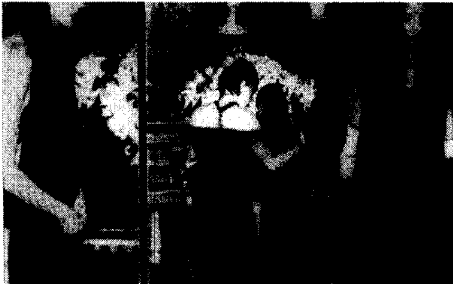
<사진 3> '00 F/W Imitation of Christ 장례식장

벗어난 비주류의 장소와 공간구성이 패션쇼의 중심으로 이동하게 된 것이며 외부로의 확장을 의미한다.