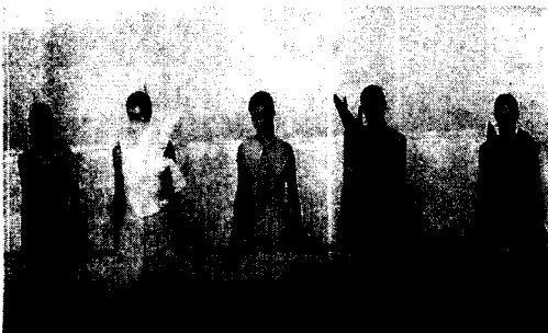
<사진 5> ‘00 S/S Hussein Chalayan Spring 2000 WRTW 2002.6.12

퍼포먼스란 기존의 예술형식의 전복과 새로운 형식에 대한 탐구로 실험적인 경향을 띠고 시각예술, 음악, 무용, 연극, 시, 영화, 비디오 아트 등 모든 장르를 포함하며 각종 매체와 유기적인 결합을 이루고 실연의 성격을 지닌다. 주로 60년대를 해프닝(Happening), 70년대를 이벤트(Event), 80년대를 퍼포먼스로 구분하며 보디 아트(Body Art), 라이브 아트(Live Art) 16) 등을 포괄한다. 퍼포먼스는 뚜렷한 장르는 아니지만 열려진 예술형식으로 장르간의 형식