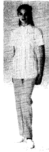
〈그림 4〉 베이지색 + 줄.