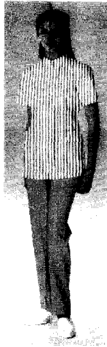
〈그림 3〉 분홍색 + 줄.