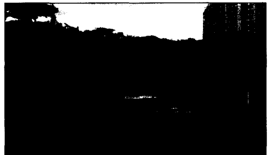
그림 3. 연못시설 이용 행태

는 이용자의 32.7%가 만족하고 있는 것으로 나타났다. 이러한 결과는 공원의 주 이용시설을 감안할 때 공원 이용자들은 '연못시설'을 자주 이용하면서도 만족도가 높은 시설임을 간접적으로 확인할 수 있었다(그림 3, 4 참조).