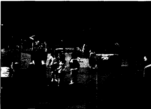
그림 5. 놀이시설 이용 행태