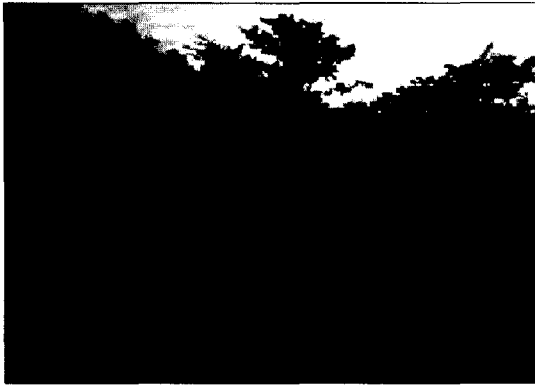
그림 2. 공원 이용자의 운동 행태

의 일관성을 추정함으로써 척도의 신뢰도를 평가하는 내적 일관성법을 사용하였고, 그 중 가장 보편적으로 사용하는 크론바흐 알파(Cronbach's of \alpha )계수에 의한 신뢰도 분석을 시행하였다. 그 결과, 항목-총점간의 상관관은 0.0886~0.4491로 확인되었고, 전체적인 신뢰도 계수인 전체 알파 값은 0.6194로 나타나 일반적인 기준인 0.60을 상회하고 있어 비교적 양호한 수준인 것으로 나타났다.