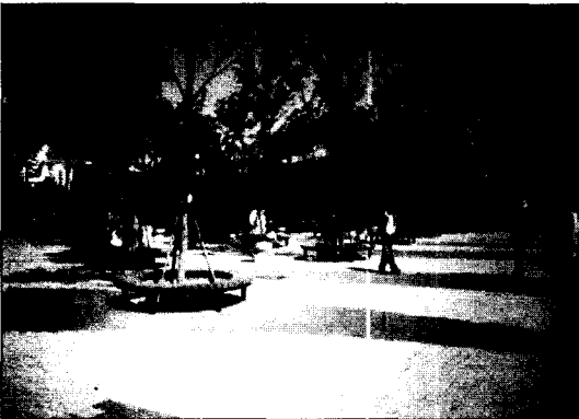
그림 6. 광장 이용 행태

특히, '광장의 유지 및 관리상태(3.62)', '광장의 청결성(3.55)'의 변수에 대해서는 이용자의 60.2%, 50.9%가 만족하고 있는 것으로 나타났고, '광장 이용 시 안전성(3.41)', '광장의 규모와 시설의 적정성(3.41)'에 대해서는 이용자의 46.0%, 46.5%가 만족하고 있는 것으로 나타났다. 이러한 결과는 "공원에 들어설 때 확트인 광장이 너무 상쾌한 느낌이 든다"와 "깔끔하게 깔린 광장이 이국적인 분위기를 주고 있어요"와 같이 인터뷰 결과에서도 긍정적으로 이용되고 있음을 간접적으로 확인할 수 있었다(그림 6 참조).