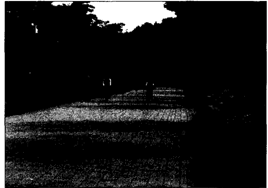
그림 4. 느티나무 산책로 이용 행태

산책로에 대한 전반적인 (불)만족 수준은 평균 3.0 이상의 수준에서 대부분의 응답자가 만족하고 있는 것으로 나타났다. 특히, '산책로의 유지 및 관리(3.66)'와 '산책로의 청결성(3.71)'에 대해서는 응답자의 66.0%, 65.4%가 만족하고 있는 것으로 나타났다. 한편, 산책로의 이용에 있어서는 "산책로에 애완용 개를 데리고 다니는 사람들이 있어 불편하다", "느티나무 산책로를 제외한 다른 산책로는 이용 시 불편한 점이 많다"와 같이 부정적인 의견도 있는 것으로 조사되었다.