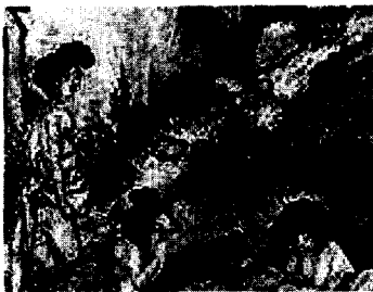
<그림 5> 신윤복의 단오풍정(端午風情) (강명관, 전개서, p. 78)

<그림 5>는 신윤복이 그린 단오풍정(端午風情)으로 기녀들에게도 가체금지령이 내려진 전후로 그려진 풍속화이다. 이 풍속화에서 보면 기녀의 엷은머리가 한쪽으로 치우치고 엷은머리의 양이 많아 가리마선이 보이지 않는 머리형태를 하고 있다.