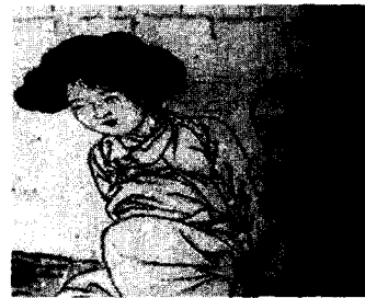
<그림 10> 신윤복의 이부탐춘(嫖婦貪春) (강명관, 전게서, p. 33)

<그림 10>은 신윤복의 이부탐춘(嫖婦貪春)으로 상중의 여인이 몸종과 함께 개의 짹짹기를 감상하고 있는 모습을 그린 것이다. 상복을 입고 있는 여인은 기와를 엷은 담장이 있는 집에서 생활하는 것으로 보아 지체가 높거나 부유한 상류층의 여인으로 보인다. 42) 상복을 입은 여인의 엷은머리 형태 역시 땅은 머리다발이 서로 겹치도록 하여 머리 위에 엷었고 풍성한 머리다발로 인해 가리마 선이 보이지 않는 것이 특징이다. 이처럼 철저한 유교사회에서 반가 부녀자들이 기녀의 머리형태를 모방할 수 있었던 것은 풍속화의 보급으로 인해 기녀의 모습을 쉽게 접할 수 있었고 43) , 축첩제도로 인해 젊고 아름다운 기녀가 첩으로 들어오면서 반가부녀자들이 소박 당하는 경우가 많았으므로 그들의 자구책으로 기녀들의 복식뿐만 아니라 머리형태 역시 많이 모방하였으리라 짐작할 수 있다.