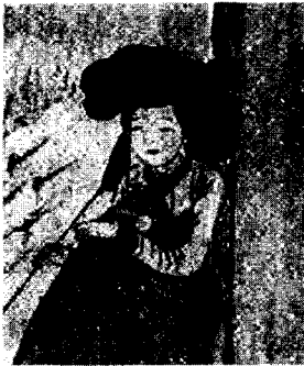
<그림 4> 신윤복의 유곽쟁웅(遊廓爭雄) (강명관, 전개서, p. 129)

였기 때문에 30) 기녀의 엷은머리 형태 역시 사실적으로 표현하였다고 볼 수 있다. 이처럼 단순하게 고대해진 엷은머리 형태에서 벗어나 본인들의 교태를 아름답게 연출하기 위해 가체를 한쪽으로 치우치게 장식했다고 사료된다.