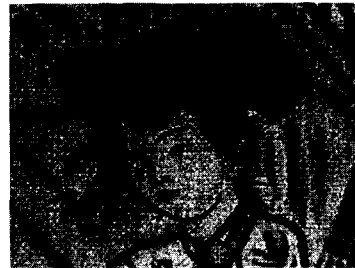
<그림 7> 신윤복의 생황 부는 여인 (강명관, 전개서, p. 165)