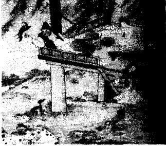
<그림 1> 김희겸의 석천한유도(石泉閑遊圖) (이태호, 전개서, p. 92)

<그림 2>는 김홍도(金弘道, 1745-1810)가 그린 부벽루연회도(浮碧樓宴會圖, 平壤監司饗宴圖)로 연대는 확실하지 않지만 가채금제령이 내려지기 전후로 그려진 것이라고 추정된다. 한쪽 부분이 치우친 엷은 머리를 한 기녀들이 열을 지어 앉아 있고 쪽진머리를 한 동기(童妓)들도 끼여 있다. 그리고 쪽진머리 형태에서 특이한 점은 쪽은 두 개인데 하나의 비녀를 사용하여 쪽을 찌었다는 것이다. 이것은 궁중에서 견습내인(見習內人)들이 하는 생머리와 형태가 유사하다고 사료된다. 생머리는 머리를 뒤에서 반으로 갈라 땀아 내려가서 다시 밑에서부터 각각 양쪽으로 말아 올려 자주색 끈으로 중허리를 묶어 주는 것 27) 에 반해 동기들의 머리형태는 자주 끈 대신 비녀를 사용하여 쪽을 찌는 것이 아닌가 생각된다.