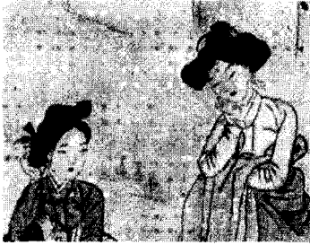
<그림 11> 신윤복의 정변야화(井邊夜話) (강명관, 전게서, p. 48)

태가 한쪽으로 기울어져 있으며 가리마 선이 보이지 않는 것을 알 수 있다.