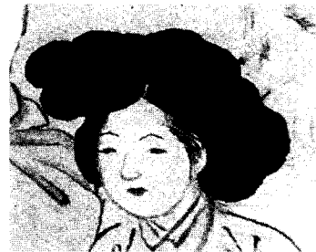
<그림 3> 신윤복의 청금상련(聽琴賞蓮) (강명관, 전개서, p. 162)

그린 청금상련(聽琴賞蓮)으로 남성의 복식을 통해 신분을 짐작할 수 있는데, 노란색 호박 갓끈이 달린 갓과 도포에 두른 자주색의 세조대(細條帶)는 당상관이 할 수 있는 것으로 28) 이를 통해 상류층의 양반 들임을 알 수 있다. 그들에게 걸 맞는 외적, 내적인 미를 갖추기 위해서 기녀들의 외모는 선정적이고 화려하게 가꿀 수밖에 없었으므로 자연스럽게 엷은머리는 고대해졌으리라 짐작할 수 있다. 그 당시 엷은머리는 크면 클수록 아름답다고 생각했기 때문에 성종조(成宗朝)에서는 성중(城中)이 고계(高髻)를 좋아하여 사방의 높이가 일척(一尺)이나 되었고, 연산군조(燕山君朝)에서는 가채(加髻)의 사치가 성행하였으며, 영조조(英祖朝)에서도 채의 비용이 백금(百金)에 이르러 모두 파산할 지경이라는 내용 29) 이 있을 정도로 여인들은 가채를 이용한 풍성한 엷은머리를 즐겼다는 것을 알 수 있다. 그러나 일반 서민 부녀자들은 가채의 비용을 감당하기 힘들었으며, 반가 부녀자들의 경우는 유교적 법규에 의해 남성들과는 격리된 생활을 하였다. 그러면서 자연스럽게 남성들이 바라는 기녀의 상은 정숙한 아내가 아닌 풍류를 알고 자신들의 눈을 즐겁게 하며, 체면까지도 던져버릴 수 있는 여인상을 원했으므로 기녀들은 자신의 직업에 충실하기 위해 고대한 엷은머리를 할 수밖에 없었다고 사료된다.