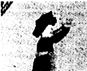
<그림 9> 선묘조제재경수연도 (국립국악원, 전게서, p. 152)

洞) 공해(公麻)에서 70세 이상의 노모를 모신 13인 재신(宰臣)들이 열었던 경수연(慶壽宴)의 장면을 19세기에 모사(模寫)한 것으로 대청에서 자제가 부인들을 향해 절을 올리고 대청 아래에서 다른 자제(子弟) 두명이 서로 마주 보고 춤추고 있는 장면이다. 41) 여기에 나타나 있는 반가 부녀자들의 머리형태는 엷은머리 형태를 하고 있으며 가야금을 연주하는 기생들의 머리형태 역시 엷은머리 형태를 하고 있다. 이 시기의 기녀들의 머리형태는 고대한 엷은머리를 하였고 반가 부녀자 역시 그림에서 보듯이 기녀들의 머리형태와 비슷하다는 것을 알 수 있다.