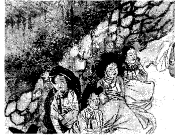
<그림 13> 신윤복의 무녀신무(巫女神舞) (강명관, 전게서, p. 232)

<그림 13>은 신윤복의 무녀신무(巫女神舞)로 굿하는 장면을 그린 것으로 그림 중앙에 쌀이 담긴 소반 앞에서 손을 비비고 있는 여인과 그 옆에 앉아 있는 여인의 머리형태 역시 한쪽으로 기울어져 있는 엷은머리를 하고 있으며 가리마 선이 보이지 않는다. 그러나 손을 비비고 있는 여인에 비해 그 옆에 앉아 있는 여인의 엷은머리가 더 고대한 것을 알 수 있다.