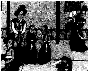
<그림 2> 김홍도의 부벽루연회도 (浮碧樓宴會圖, 平壤監司饗宴圖) (국립국악원, 전개서, p. 192)

<그림 2>는 김홍도(金弘道, 1745-1810)가 그린 부벽루연회도(浮碧樓宴會圖, 平壤監司饗宴圖)로 연대는 확실하지 않지만 가채금제령이 내려지기 전후로 그려진 것이라고 추정된다. 한쪽 부분이 치우친 엷은 머리를 한 기녀들이 열을 지어 앉아 있고 쪽진머리를 한 동기(童妓)들도 끼여 있다. 그리고 쪽진머리 형태에서 특이한 점은 쪽은 두 개인데 하나의 비녀를 사용하여 쪽을 찌었다는 것이다. 이것은 궁중에서 견습내인(見習內人)들이 하는 생머리와 형태가 유사하다고 사료된다. 생머리는 머리를 뒤에서 반으로 갈라 땀아 내려가서 다시 밑에서부터 각각 양쪽으로 말아 올려 자주색 끈으로 중허리를 묶어 주는 것 27) 에 반해 동기들의 머리형태는 자주 끈 대신 비녀를 사용하여 쪽을 찌는 것이 아닌가 생각된다.