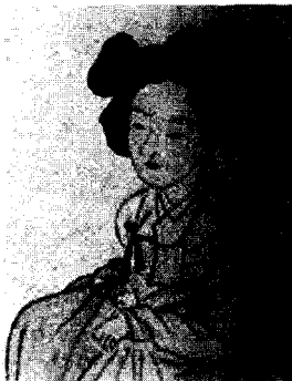
<그림 12> 신윤복의 이승영기(尼僧迎妓) (강명관, 전게서, p. 78)

<그림 12>는 신윤복이 그린 여승과 여인이라는 작품으로 장옷을 쓴 여인네가 여종과 함께 절로 가는 길에 샷갓을 쓴 비구니가 마중을 하고 있는 장면이다. 하녀의 머리형태 역시 한쪽으로 기울어져 있으며 가리마 선이 보이지 않는 것을 알 수 있다.