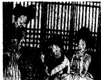
<그림 6> 유윤홍의 기생들 (강명관, 전개서, p. 121)

<그림 6>은 유윤홍(1797-1859)이 그린 기생이라는 작품으로 가운데 앉아 있는 기녀가 땡은 머리다발을 머리에 두르려고 하는 장면으로 보인다. 엷은머리 형태가 고대해지면서 땡은 머리다발이 머리 위에서 흘러내리지 않도록 고정하기 위해서는 계(髻)를 서로 겹치도록 틀어 엷었으며, 보다 아름답게 장식하고자 고려시대의 추마계(墜馬髻) 31) 처럼 한쪽으로 치우친 엷은머리형태가 나타났을 것으로 사료된다. 이것은 <그림 5>보다 후대에 그려진 것으로 가리마선이 보이지 않으면서 한쪽으로 머리다발이 치우쳐 있는 것을 볼 수 있다. <그림 7>은 신윤복이 그린 생황 부는 여인으로 여기에서도 땡은 머리다발이 서로 겹쳐지도록 틀어 엷은 기생의 머리형태를 볼 수 있다.