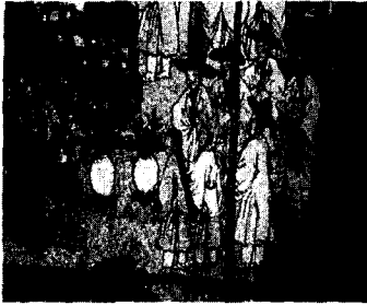
<그림 8> 평생도 - 回甲 (『韓國의 美 民 畫』, 중앙일보, p. 128)

洞) 공해(公麻)에서 70세 이상의 노모를 모신 13인 재신(宰臣)들이 열었던 경수연(慶壽宴)의 장면을 19세기에 모사(模寫)한 것으로 대청에서 자제가 부인들을 향해 절을 올리고 대청 아래에서 다른 자제(子弟) 두명이 서로 마주 보고 춤추고 있는 장면이다. 41) 여기에 나타나 있는 반가 부녀자들의 머리형태는 엷은머리 형태를 하고 있으며 가야금을 연주하는 기생들의 머리형태 역시 엷은머리 형태를 하고 있다. 이 시기의 기녀들의 머리형태는 고대한 엷은머리를 하였고 반가 부녀자 역시 그림에서 보듯이 기녀들의 머리형태와 비슷하다는 것을 알 수 있다.