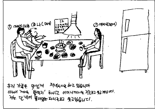
〈그림 2〉 가족에 대한 만족수준