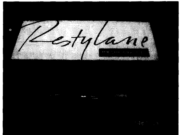
Fig. 2. Commercially available Restylane (Hyaluronic acid).