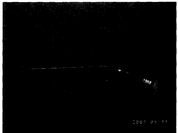
Fig. 3. Restylane with a laryngeal injector needle (26 gauge, Bayonet type).

성형술 후 성문 부전증, 좌측 성대마비 진단하에 후두 미세 수술하에 좌측 성대 내에 Restylane 주입을 계획하였다(Fig. 2). 수술은 전신 마취하에 시행되었으며 후두현수경을 적용한 상태에서 시행되었다. 수술시 Restylane을 26G의 가늘고 긴 바늘(Fig. 3)에 연결하여 성대 중간부위의 성대근(vocalis muscle)과 성대인대(vocal ligament)에 충