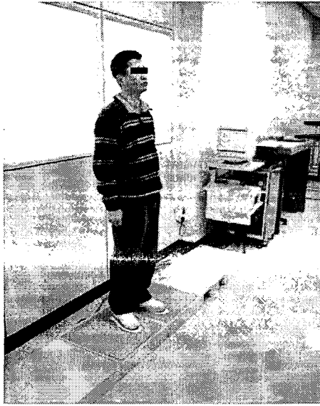
그림 3. 정적 체중부하 측정자세