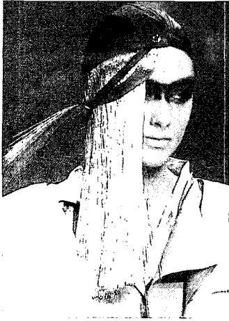
<그림 12> 모던 테크노 헤어 스타일('91-'92 A&W Paris London Collections, 1991)