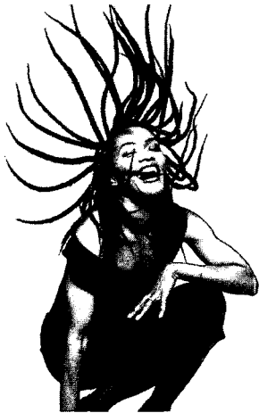
<그림 4> 음악 이미지에서의 헤어스타일(세기의 헤어아티스트, 현문사, 2001)