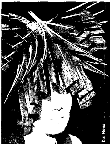
<그림 5> 음악 이미지에서의 헤어 스타일(Beauty Book「Paris, Milan, N. Y., London Collections」; Vogue Korea 2002. 1 별책부록)