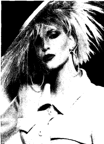
<그림 14> 사이버 핑크 헤어 스타일(Collezioni Donna, Haute Couture S/S, 1987, No. 45)