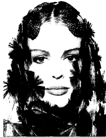
<그림 6> 음악 이미지에서의 헤어 스타일(Int'l Hair Magazine 「Passion」, Dowa Planning Inc., Apr. 1994, Vol. 53)