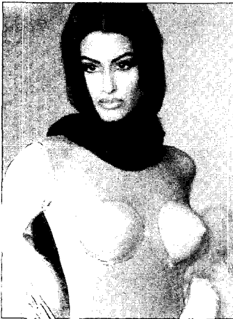
<그림 13> 모던 테크노 헤어 스타일('91-'92 A&W Paris London Collections, 1991)

테크의 성격을 규정한 말과 사회문화적 반항이나 이단을 나타내는 말의 융합이다. 따라서 사이버 펑크는 그 이름이 암시하듯이 급진주의 성향을 띄고 있다고 할 수 있다 27) . 사이버 펑크는 사이버에서 발생하는 하이테크 문화와 펑크에서 유발되는 밑바닥 거리문화의 결합물이다.