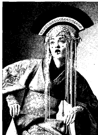
<그림 3> 키네틱 이미지의 헤어스타일(보그코리아, 1999. 5)