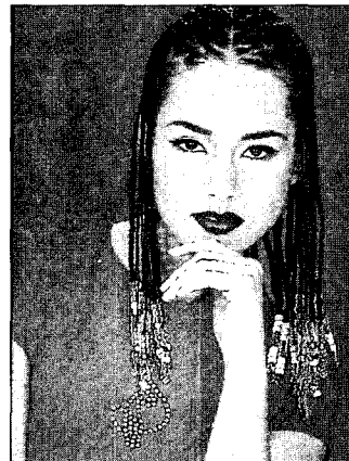
<그림 2> 키네틱 이미지의 헤어 스타일('91-'92 A&W Paris London Collections, 1991)