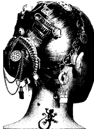
<그림 1> 키네틱 이미지의 헤어스타일(세기의 헤어 아티스트, 현문사, 2001)