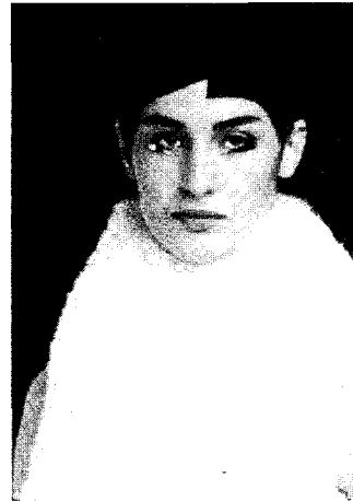
<그림 8> 스페이스 헤어스타일(Extreme Beauty, 2001)

스페이스 헤어는 간결하게 조형미를 표현하는 스타일로서 미래적 이미지를 나타내는 스타일이다. 즉, 스페이스 헤어스타일은 전시대의 과다한 장식성에서 벗어나 기하학적 실루엣과 단순화된 형태, 다양하고 새로운 소재를 사용하여 미래지향적인 성향을 보이고 인체에 대한 헤어스타일의 새로운 조형미를 제시해 줄뿐만 아니라, 현대 사회의 기계화를 낙관적인