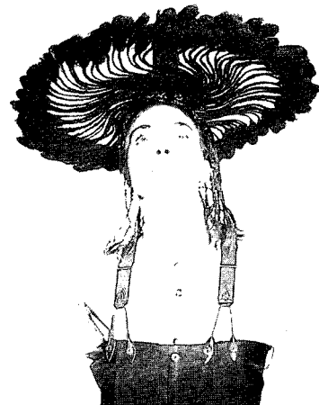
<그림 7> 음악 이미지에서의 헤어 스타일(Int'l Hair Magazine 「Passion」, Dowa Planning Inc., Apr. 1994, Vol. 53)

다는 ‘spatium’이라는 그리스어에서 비롯된 말이다. 또 피타고라스(Pythagoras)는 코스모스(cosmos)란 단어를 우주의 의미로 사용한 이래, 질서와 미의 근거가 항상 함의되어 인류의 과학적, 형이상학적 고찰의 사상적 기반이 되었다 16) . 스페이스 룩은 일반적으로 스페이스 의상과 스페이스 헤어를 뜻한다. 스페이스 패션은 코스모스 패션(cosmos fashion), 우주패션 등으로 다양하게 표현되며, 또한 1960년대 후반에 유행한 것으로 1970년대 말에 등장한 영화 「스타워즈」의 영향에 의해 스페이스 룩이라고 하였다 17) . 스페이스 룩은 미래지향적인 이미지와 함께 미니멀리즘을 반영한다.