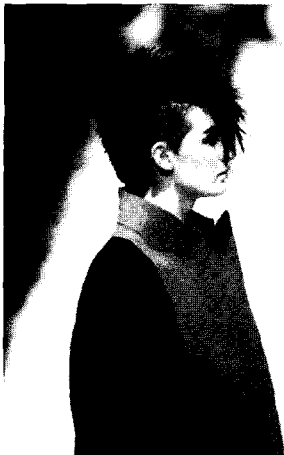
<그림 15> 사이버 핑크 헤어 스타일(Gaultier 2001 FW Collection)

스파이키(spiky) 헤어스타일이 변형된 핑크 헤어스타일로서 금색 색상을 이용하여 미래적 이미지를 표현하고 있는 사이버 핑크 헤어스타일이고, <그림 15>는 헤어를 핑크형식으로 세운 사이버 핑크 헤어스타일이다.