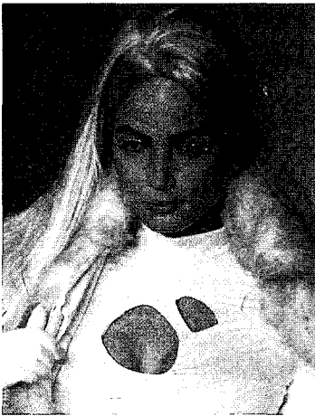
<그림 10> 테크노 헤어스타일('91-'92 A&W Paris London Collections, 1991)

<그림 10>은 히피적 이미지가 가미된 테크노 패션과 일치되어 테크노 헤어스타일 이미지를 나타내고 있다. 또 형광물질로 컬러링함으로써 은색의 반짝이는 재질의 의상과 조화되고 있다. <그림 11>은 홀로