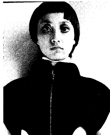
<그림 9> 스페이스 헤어스타일(Extreme Beauty, 2001)

시각으로 인식하고 과학 문명의 테크놀로지와 의상 및 헤어스타일의 조합에서 비롯되는 새로운 가능성을 열어주었다. <그림 8> 및 <그림 9>는 미래적 이미지를 도출하고 단순하게 커트한 것으로 대표적 스페이스 헤어형식이다. 도형을 모티프한 앞머리의 기하학적인 사선 처리는 미래적인 의상표현의 소재에 부가되어 더욱 강한 이미지를 표현한다.