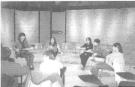
〈4-5학년 학생들이 약 15명이 모여 책에 대해 토론하는 모습〉

학교도서관은 그 학교의 주민 대표들로 구성된 해당 학군의 Board of Education에서 예산을 할당받아 운영된다. 미국에서는 각 주마다 조금씩 다르지만 뉴욕 주에서는 모든 중학교, 고등학교에 사서교사(Library Media Specialist)를 고용할 것을 법으로 정하고 있다. 하지만 재정적으로 어려운 학군을 제외한 대부분의 초등학교에서도 자체적으로 사서교사를 채용하고 있다. 미국에서 사서교사의 중요성이 부각되기 시작한 것은 1988년 미국도서관협회(ALA)산하 미국 사서교사협회(AASL)에서 『정보의 힘: 학교내 도서관 미디어 프로그램 운영에 관한 지침서(Information Power: Guidelines