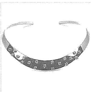
TWIN Bio 주얼리 - 목걸이

본사 : 서울특별시 송파구 가락동 175-6 신한빌딩 전화 : 02) 443-6942~4 팩스 : 02) 443-6945