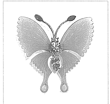
TWIN Bio 주얼리 - 브로치