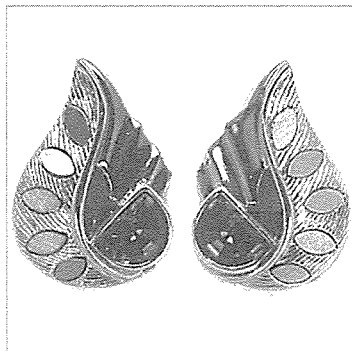
TWIN Bio 주얼리 - 귀걸이