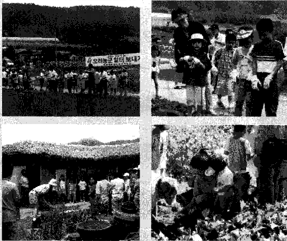
▲ 도농교류를 통해 농업·농촌의 재인식 기회로...

향후 재택근무의 활성화는 농촌의 정주공간기능을 재점화시킬 것이다. 농촌에 머물면서 고속통신망을 이용한 재택근무가 인기를 끌면서 젊은이들의 농촌정