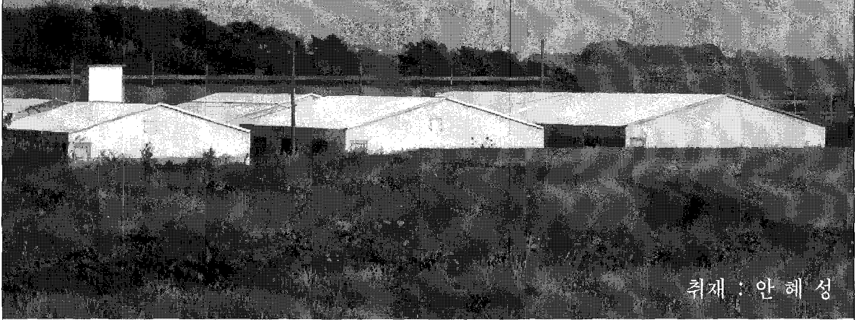
취재 : 안혜성

포 업의 도시인 경기도 평택시 고덕면에 서 우수 종돈을 양돈농가에 보급함 으로써 양돈산업 발전에 기여하는 경북종돈을 찾았다.