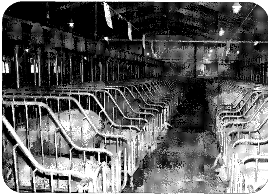
▲ 경북종돈 임신사 내부 모습.