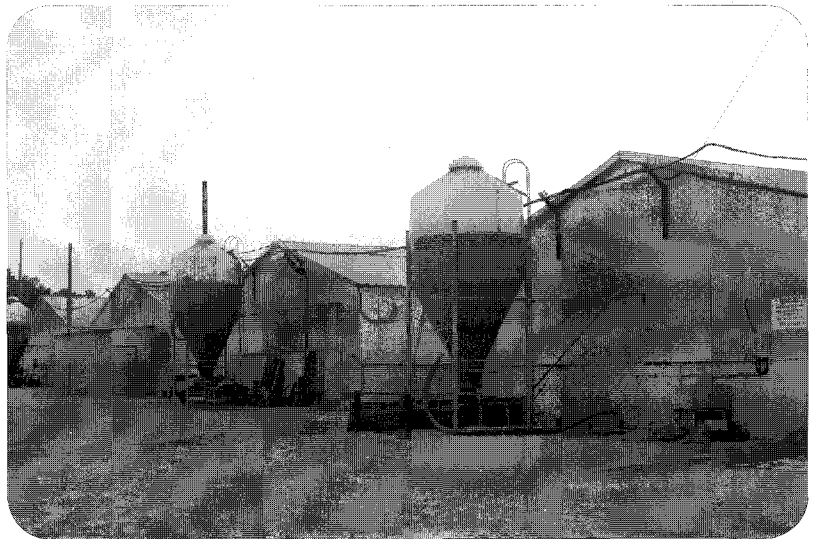
▲ 지난해 신축한 GGP 돈사 전경

경북종돈은 세계 3대 육종회사인 캐나다 제네틱 포크로부터 선발지수 150 이상의 고능력 종돈을 직수입해서 GGP 종돈으로 사용하고 있으며 산자수, 유선 발달, 이유두수, 공태일수