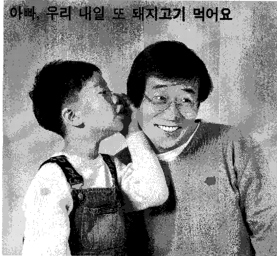
아빠, 우리 매일 또 돼지고기 먹어요

국산 돼지고기의 우수성과 다양성을 집중적이고, 다각적으로 홍보하여 수출부위(안·등심, 후지) 소비 확대를 유도함은 물론, 나아가 안전하고, 위생적인 국산 돼지고기를 생산하여 해외 수출시장도 개척할 수 있을 것이다.