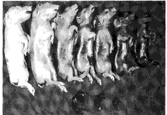
▲미이라 태아 3두, 흑자 5두, 뇌수종 2두(미이라화된 태아에서부터 사산된 태아까지 고른 현상을 나타냄)