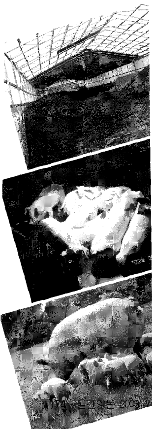
112 친환경양돈 2009

- 재배토양의 역사, 생산된 작물과 가축 종류 등 농장의 특별한 요인에 의해 결정되는 적정한 기간의 전환기를 경과하여 유기농장으로 확립하는 것