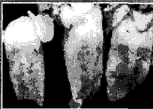
· 수포가 터져 돼지의 혀에 생긴 궤양