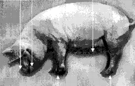
· 발굽 사이의 수포, 궤양